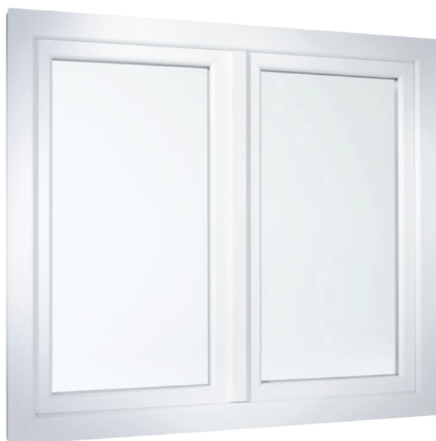
2-flügeliges Fenster in flächenversetzter Variante