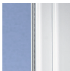
Schwungvolles Design mit runder Kontur

Mit modernen Kunststofffenstern aus VEKA Profilen gewinnt jedes Haus. Denn das Design des SWINGLINE Systems mit der charakteristischen Rundung harmonisiert hervorragend mit unterschiedlichsten Architekturstilen – ob modern oder traditionell, ob Neubau oder Renovierung.